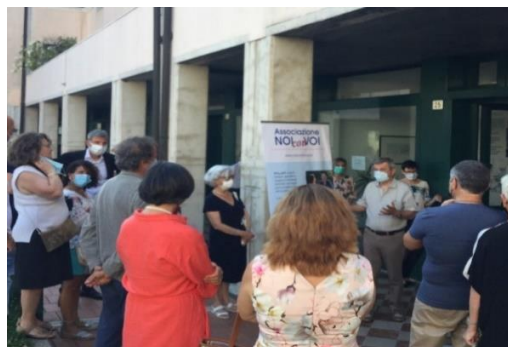
Foto in basso , I partecipanti, I saluti