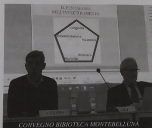
CONVEGNO BIBLIOTECA MONTEBELLUNA

NOIconVOI è un'associazione senza scopo di lucro. Ne fanno parte oltre 150 famiglie che hanno scelto di affrontare assieme il bisogno di assistenza domiciliare. L'associazione nasce nell'ottobre 2015 a Montebelluna. La missione dell'associazione, ovvero, il motivo per il quale è stata costituita è quello di aiutare le famiglie ad individuare l'assistente familiare che al meglio potrà prendersi cura degli anziani e, in generale, di chi ha bisogno di assistenza domiciliare. NOIconVOI, con le sue sedi di Montebelluna, Castelfranco e Treviso, copre con i suoi servizi di assistenza alle famiglie associate un ampio territorio che comprende la provincia di Treviso e parte di quelle di Belluno, Vicenza, e Venezia. L'associazione è in grado di offrire per